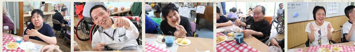
1 豪華なデザートプレート

年に2回の喫茶の日。今回のメニューはコーンマヨパン、チーズポテト、チョコチップクッキー、水ようかん、ゼリーなど8種類です。その中でも特にカラフルな果物が入ったフルーツサンドの断面は、SNS 映え間違いなし、というほど綺麗でした。今回も日清医療食品の皆様が手作りしてくださったスイーツは、カラダにも優しく、おいしい物ばかりでした。