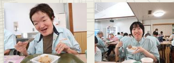
ケーキを見ているだけで、笑顔に。

今月のケーキは茨城県産の「和栗のモンブラン」です。香り高い和栗の風味と優しい甘さでした。