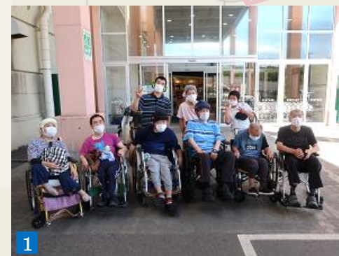
1 写真撮影より、早く買物がしたいという気持ちを抑えながらの集合写真。