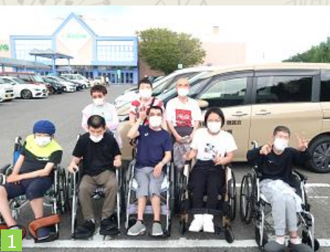
1 今月の買物訓練のメンバー8名。サンパークあじす駐車場にて。