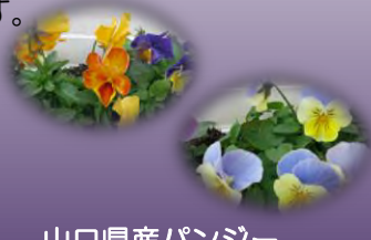
山口県産パンジー